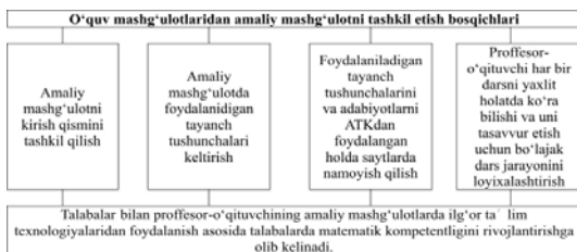
2-rasm. Amaliy mashg'ulotini tashkil etish bosqichlari

Ta'limni yaxlitligini ta'minlashda fanlararo ichki va tashqi bog'lanishlarini ta'minlash juda zarur qadam hisoblanadi. Shunday ekan ta'limning o'rtasi umumiy va oliy ta'limda ham bosqichlararo bog'lanishni amalga oshirish ma'lum ma'noda ta'lim sifatiga ta'sir etadi. Zero, har qanday fanni o'rganishda o'tilgan mavzuni bilmaslik yangi mavzuni tushunmaslikka sabab bo'ladi. Ayniqsa, matematikani yaxshi